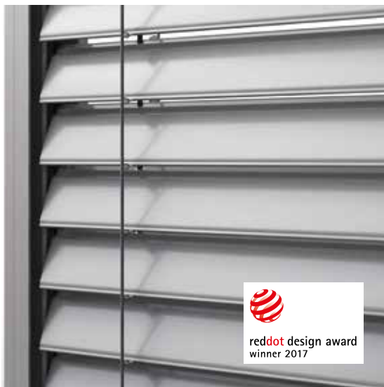
Element gekonnter Lichtsteuerung: ROMA Comfort & Design Lamelle CDL

Sehen Sie Sonnenstrahlen doch einfach wie Einrichtungsgegenstände. Oder testen Sie Ihre Einrichtung in verschiedenen Stimmungen. So wird Licht zum Gestaltungselement.