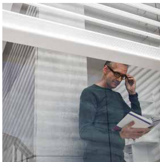
Tageslicht nutzen, ohne davon gestört zu werden