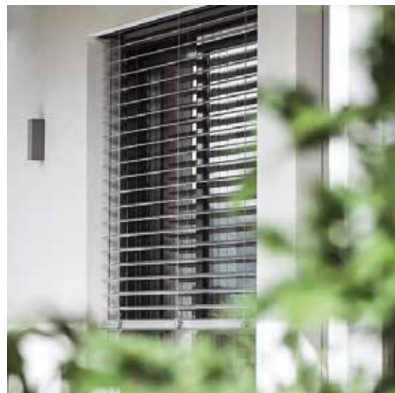
Sonnenschutz, ohne sich komplett von der Umwelt abzuschotten